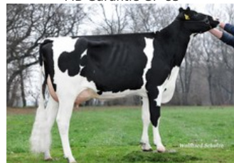
SHA Gerenuk EX-91

Comeback x GP-83 Beachboy x GP-83 Timberlake x Benz x VG-87 Rubicon x EX-91 Balisto x VG-87 Numero Uno x VG-87 Baxter x VG-86 Goldwyn x VG-88 Tugolo