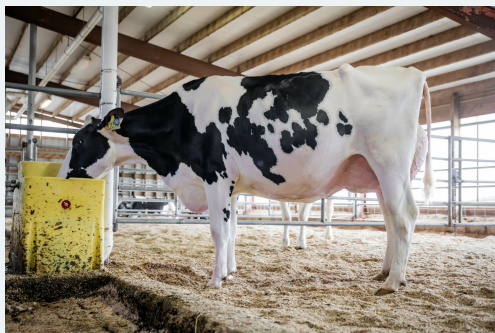
Moeder van Hi-Note

Vader van de embryo's is de stier Beyond Hi-Note , een Figaro-zoon uit de recent EX-90 ingeschreven AOT Delxue Hi-Lighted! Hi-Note brengt een torenhoge 3263 gTPI met zich mee. Daarnaast vererft hij hoge gehalten (VS-basis), een goede levensduur van +4.3 PL, +2.01 gPTAT en een gunstige hoogtemaat van +0.90.