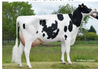
SHA Grumeti VG-87