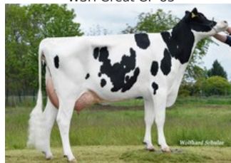
SHA Grumeti VG-87