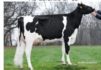
SHA Gerenuk EX-91

Comeback x GP-83 Beachboy x GP-83 Timberlake x Benz x VG-87 Rubicon x EX-91 Balisto x VG-87 Numero Uno x VG-87 Baxter x VG-86 Goldwyn x VG-88 Tugolo