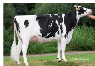
MB Garantie GP-83