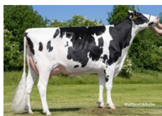
WSH Great GP-83