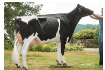
Maybelline Tual VG-85