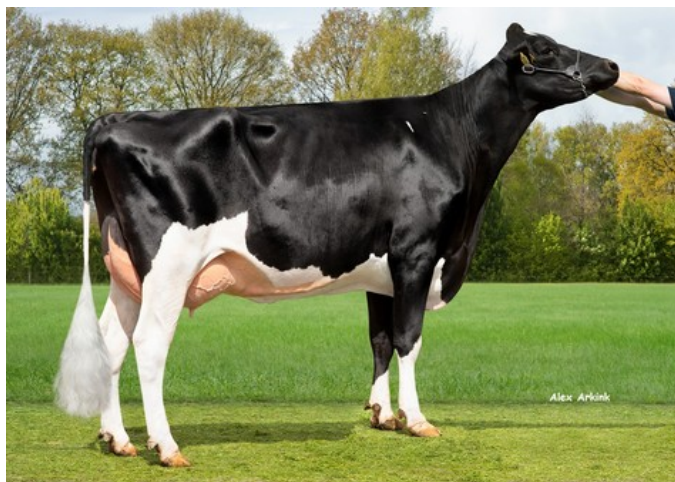
3STAR OH Maline