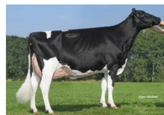
A-L-H Australia RDC VG-87