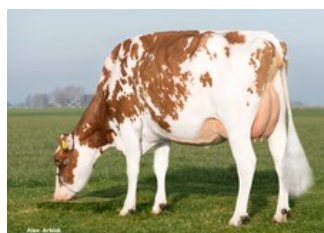
Batouwe Salsa Aiko Red VG-85