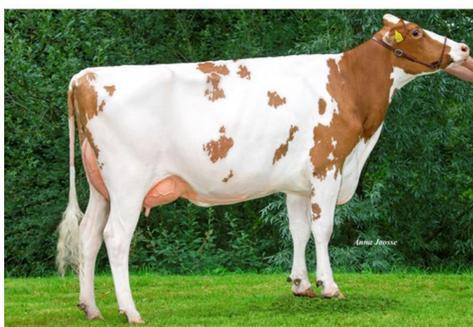
R&B Solitair Aisha P Red