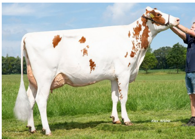
K&L SV Sunny Red