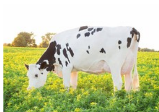
Dymentholm Sunview Sunday VG-87