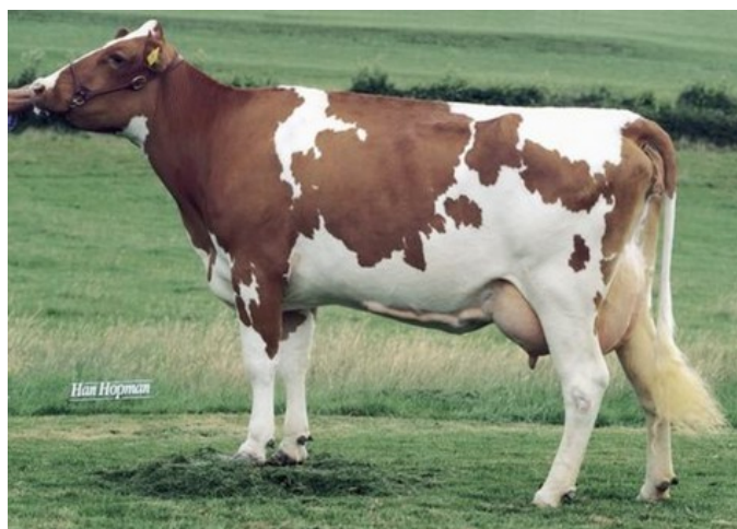
Apina Massia 14 VG-85

Rammstein Red x GP-84 Stamkos RC x VG-85 Jacuzzi-Red x VG-87 Nova Star x Supershot x VG-87 Cycloon x VG-85 Kodak x GP-83 Tequila x GP-81 Gogo x G-77 Rubens-Red