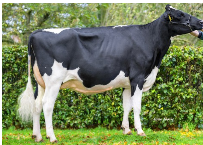
Simons 3STAR Madam