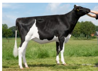
K&L OH Mallory