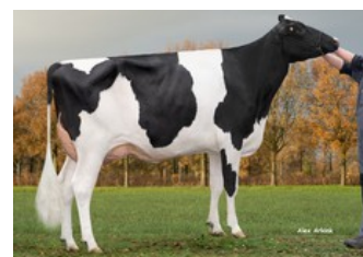
K&L OH Mabel