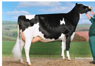
KNS Rendezvous VG-85