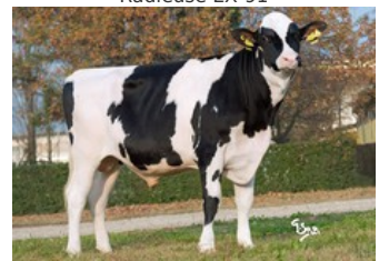
KNS Brasileiro (v. Balisto)

Cartoon P Red x VG-86 Solitair P Red x Styx Red x GP-84 Silver x GP-84 Chevrolet x VG-85 Man-O-Man x VG-86 Goldwyn x EX-91 Jocko x VG-86 Labelle x VG-85 Oscar