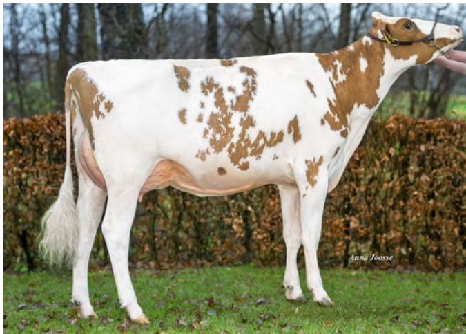
Schuit Solana P Red