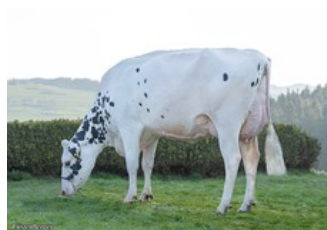
MS Salvatore Asia RDC EX-90