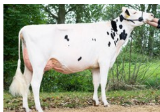
VO Ariel VG-87