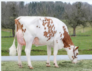
Crown-Red x MS Salvatore Asia RDC EX-90

Almetta voert terug op stamkoe Gold-N-Oaks Morty Malibu, echter via de moederlijn Alexia VG-85, x VO Ariel VG-87 x MS Salvatore Asia RDC VG-85. Moeder Alexia is tevens de volle zus van de stier Picasso @ VOST en de stier Tgd-Swiss-Repro Astral @Swiss Genetics stamt ook uit deze lijn. Vrouwelijke dieren in deze pedigree laten een indrukwekkende hoeveelheid vet & eiwit zien met een goede hoeveelheid melk!