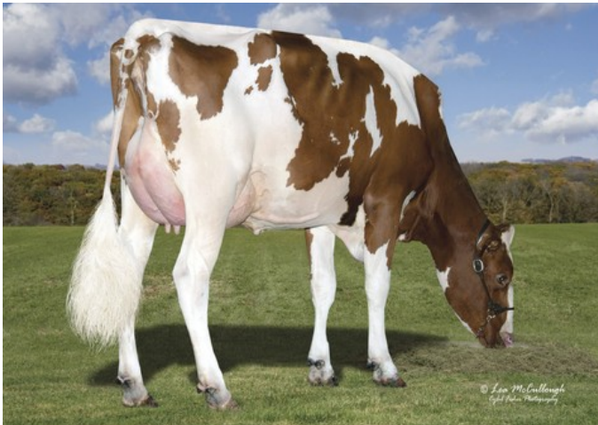
Tiger-Lily Dtry Lana-Red EX-91