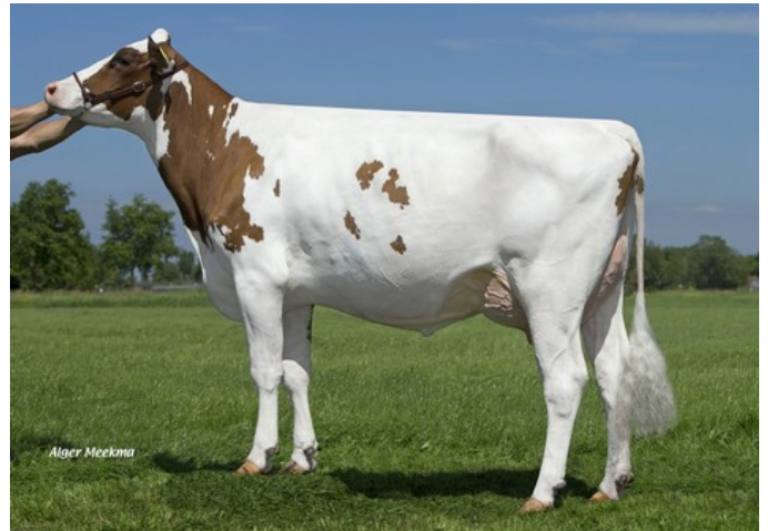
Caudumer Lol 305 PP Red VG-87

VG-86 Balisto x VG-87 Magna P RF x VG-87 Lawn Boy P-Red x VG-87 Stadel x VG-87 Lightning RDC x ?