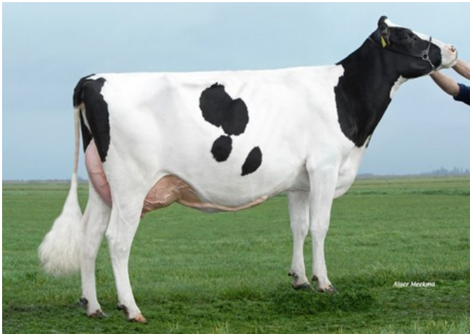
Caudumer Lol 371 P RDC VG-86