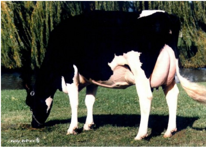
Snow-N Denises Dellia EX-95