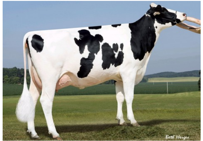
Sandy-Valley IO Amethyst VG-87

VG-86 Supershot x VG-85 McCutchen x VG-87 Altalota x VG-87 Planet x EX-92 Bolton x VG-87 Forbidden x VG-89 BW Marshall x VG-87 Rudolph x EX-90 Tesk x EX-95 Chief Mark