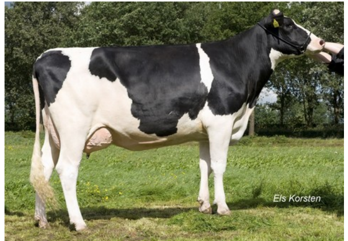
Anderstrup Bolton Elita VG-85

GP-84 Supersire x VG-86 Bookem x VG-85 Bolton x VG-87 O Man x EX-90 Mtoto x EX-90 Rudolph x EX-95 Leadman x VG-89 Blackstar x VG-87 Jason x EX-91 Valiant