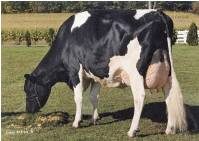
Whittier-Farms Lead Mae EX-95