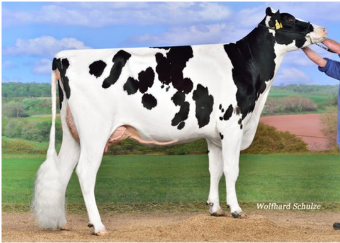
KNS Georgia-P GP-84