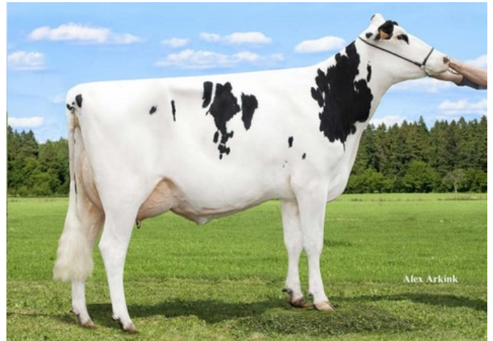
DKR Silence Secret RC VG-85

Silver x GP-83 Earnhardt P x GP-82 Colt P x VG-85 Socrates x VG-87 Goldwyn x VG-87 Durham x VG-86 Formation x VG-88 Aerostar x EX Enhancer x EX Christopher