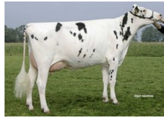
Southland Dellia 152 VG-87