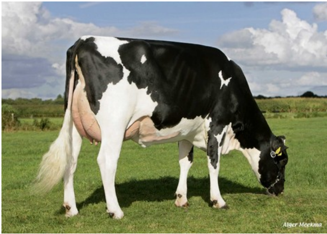
Southland Dellia 9765 VG-86