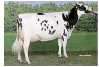
Southland Dellia 130 VG-87