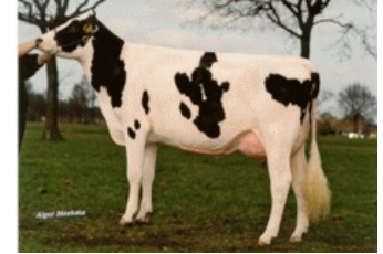
Southland Dellia 2 VG-88

VG-86 Battlecry x GP-84 Galaxy x VG-86 Man-O-Man x VG-87 Roumare x VG-87 Shottle x EX-90 Adam x VG-88 Lucky Leo x VG-86 Largo x VG-88 Jabot x VG-87 Southwind