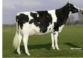
Southland Dellia 44 EX-90