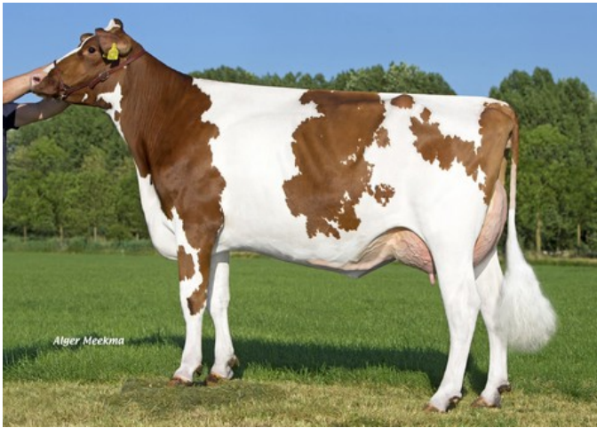
K&L RM Marica Red VG-87