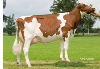
Mellencamp Massia Red VG-87