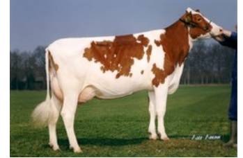
Apina Massia 20 VG-89

VG-87 Sunfish RDC x VG-86 Fanatic x VG-85 Kylian x VG-86 Lawn Boy P-Red x VG-87 Talent x VG-89 Lentini x VG-85 Tulip x VG-86 Andries x VG-85 Jubilant RF