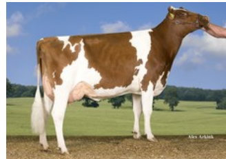
Willem's Hoeve Marcia 4815 P VG-85