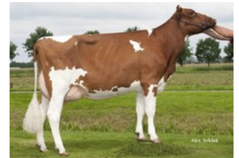
Mellencamp Massia 7731 P-Red VG-