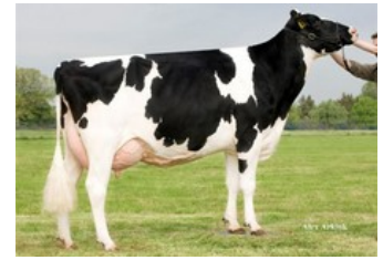
Holbra Pam VG-87