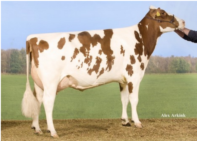
Willem's Hoeve Rita 0438 Red VG-87