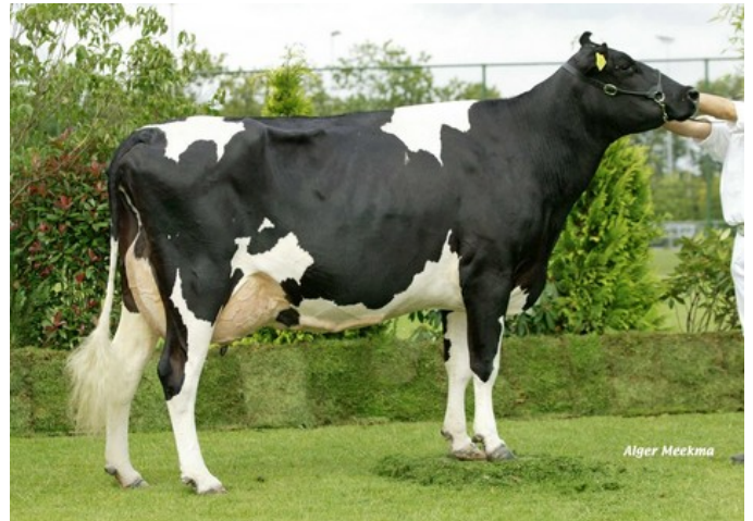
Willem's Hoeve Rita 233A EX-92

VG-89 Jerudo x VG-87 Mr Burns RC x VG-88 Lightning RDC x VG-88 Marshall x EX-92 Lord Lily x EX-93 Sunny Boy x EX-93 F16