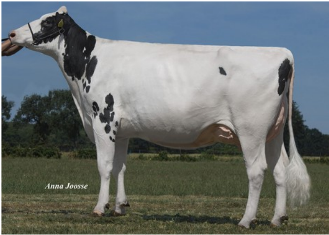
Southland Silvy Lucy EX-90