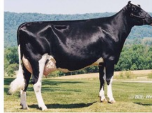
Savage-Leigh Bellwood Linda EX-92