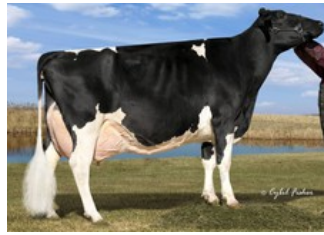
Calbrett Shottle Lucy EX-94