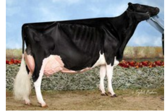
Savage-Leigh Leona EX-96

EX-90 Silver x VG-86 AltaOak x VG-86 Dorcy x EX-93 Goldwyn x EX-94 Shottle x VG-89 Durham x EX-92 Bellwood x VG-87 Blackstar x EX-90 Glenview Joe