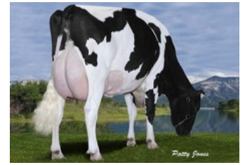
Gen-I-Beq Goldwyn Secret RC VG-87