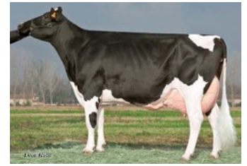
Royal Idevra Titanic Estate EX-90