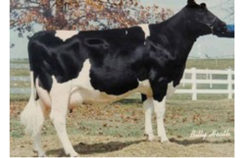
Ricecrest Southwind Kaye VG-87

VG-86 Bookem x VG-86 Active x EX-90 Titanic x VG-85 Addison x VG-86 Manfred x EX-90 Duster x EX-91 Luke x VG-87 Southwind x EX-91 Ned Boy x VG-87 Jemini