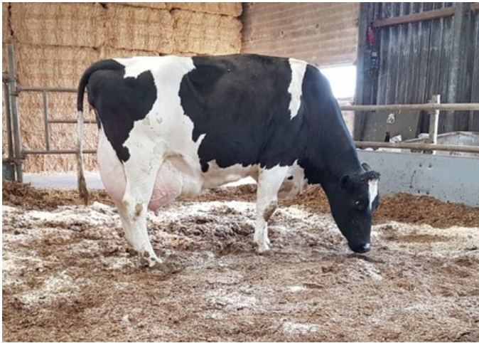
HS Excitement VG-86