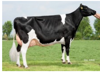
De Biesheuvel Javina 19 VG-88