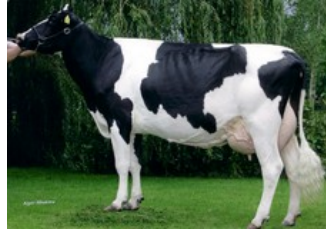
De Biesheuvel Delta Javina VG-88