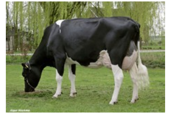
De Biesheuvel Javina 3 VG-87