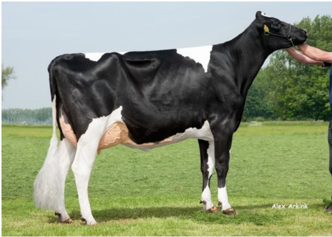
Willem's Hoeve Javina 903 TY VG-87