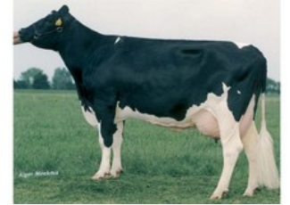
Delta Jabikje VG-85

VG-87 Sudan x VG-88 Bolton x VG-87 O Man x VG-88 Dustin x VG-85 Webster x VG-85 Branco x VG-87 Jabot x VG-86 Mascot x GP-81 Blackstar x VG-87 Chief Mark Vroege Sudan uit Javina 19