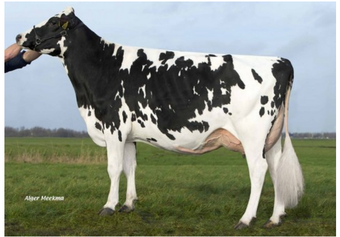
NH Super Islandwave EX-91

VG-86 Balisto x VG-89 Mogul x EX-91 Superstition x VG-86 Shottle x EX-91 Juror Ford x VG-85 Cleo x VG-89 Aerostar x EX-92 Ugela Bell x EX-94 Ben