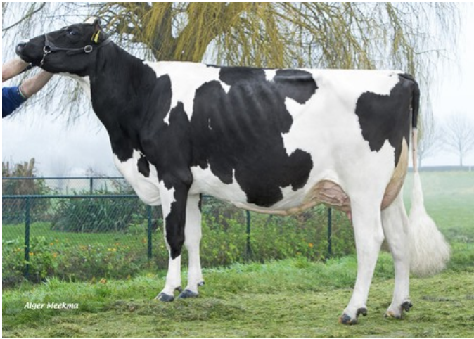
Riethil Summer Love (v. Balisto) VG-86