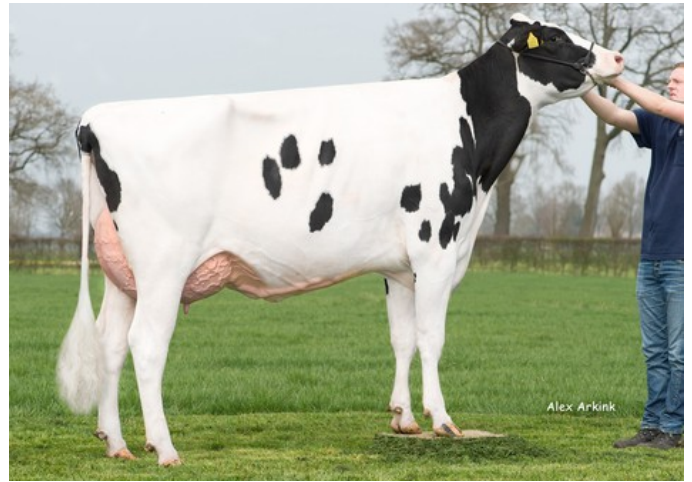
Holbra Sancodi VG-88

VG-88 Commander x VG-87 Meridian x VG-89 Snowman x VG-85 Bolton x VG-87 O Man x EX-90 Morty x VG-88 Durham x EX-90 Rudolph x EX-95 Chief Mark x EX-91 Sexation