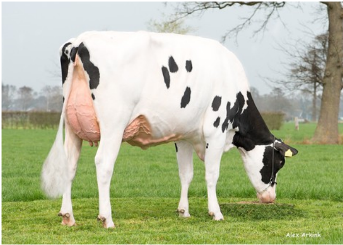
Holbra Sancodi VG-88