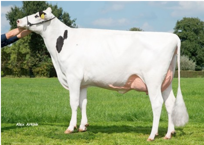
Holbra Sandoya VG-86