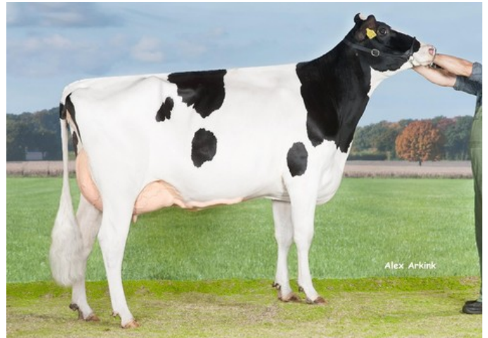
Holbra Sandian VG-88

VG-86 Kingboy x VG-88 Meridian x VG-89 Snowman x VG-85 Bolton x VG-87 O Man x EX-90 Morty x VG-88 Durham x EX-90 Rudolph x EX-95 Chief Mark x EX-91 Sexation