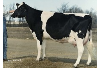
Etazon LL Neon VG-85