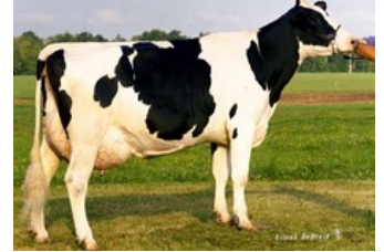
Tui Onyx Nick VG-86

Commander x VG-88 Ladd P x VG-85 Lawn Boy P-Red x G-79 Sharky x VG-86 BW Marshall x VG-85 Lord Lily x VG-86 United Nick x VG-89 Ned Boy x VG-86 Bell