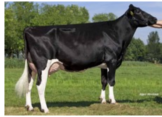
VanHolland Shakira 1 P RDC VG-85