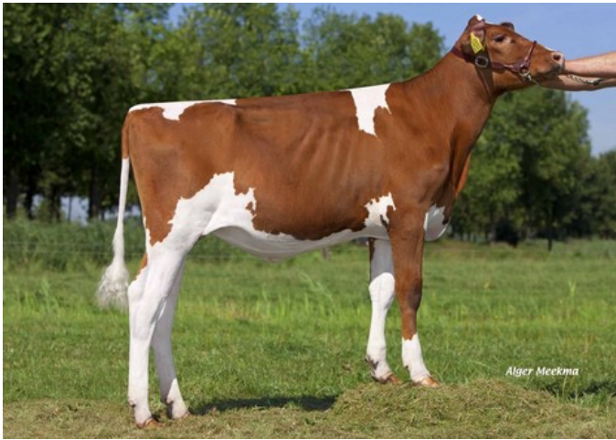
VanHolland Shakira 3 PP-Red VG-88