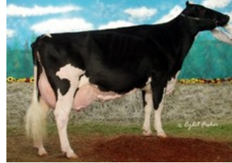
Windy-Knoll-View Promis EX-95