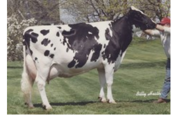
Windy-Knoll-View Ultimate Pala EX-94

VG-89 Supershot x VG-86 Snowman x VG-88 Planet x EX-93 Outside x EX-95 Rudolph x EX-94 Ultimate x VG-88 Lester