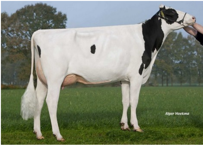
FG Feline VG-86