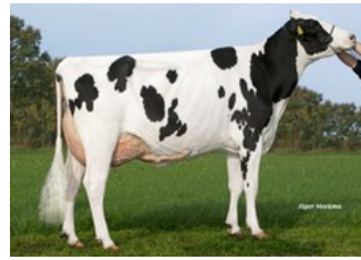
FG Policy VG-88