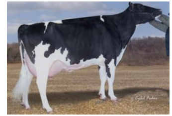
Windy-Knoll-View Policy EX-93