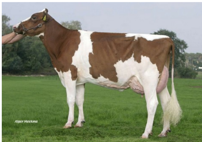
Green-Valley Allure-Red VG-87