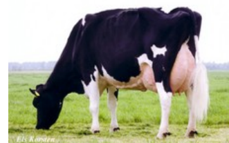
Green-Valley Anita VG-89

VG-87 Spencer x VG-86 Canvas x VG-89 Jesther x VG-85 Cash x VG-87 Captain x VG-87 Cleitus x GP-83 Big Al x VG-88 Nugget x EX-94 Arlinda Chief x EX-90 Kingpin