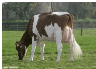
Green-Valley Allure-Red VG-87