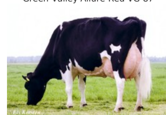
Green-Valley Anita VG-89

VG-87 Spencer x VG-86 Canvas x VG-89 Jesther x VG-85 Cash x VG-87 Captain x VG-87 Cleitus x GP-83 Big Al x VG-88 Nugget x EX-94 Arlinda Chief x EX-90 Kingpin