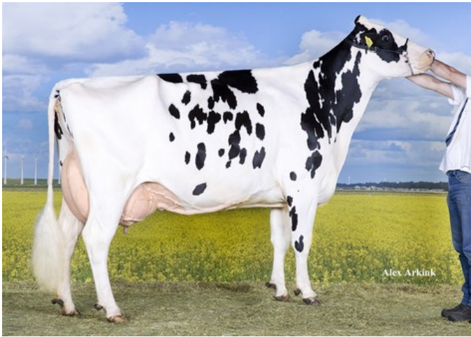
Giessen Cinderella 15 EX-91