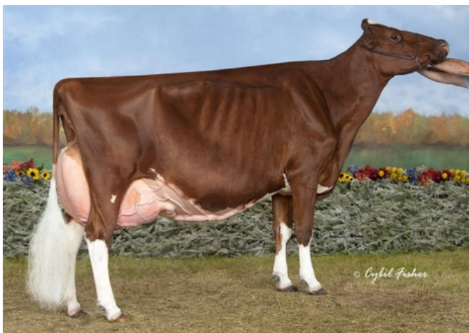
KHW Regiment Apple-Red EX-96