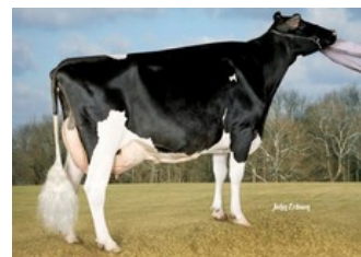
Kamps-Hollow Durham Altitude EX-95