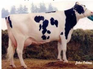
Clover-Mist Alisha EX-93