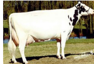
D-R-A August EX-96

VG-86 Aikman RDC x EX-90 Shottle x EX-96 Regiment x EX-95 Durham x EX-93 Prelude x EX-94 Jubilant RF x EX-96 Marquis King x EX-90 Brutus x EX-90 Lucifer Lad