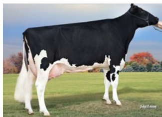
MS Apple Brandy RDC EX-90