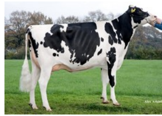
Manders Dellia 8 GP-84