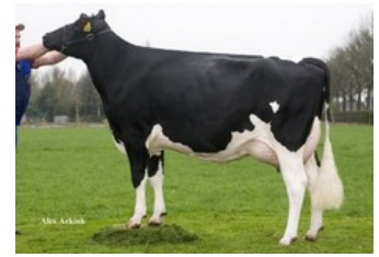
Manders Dellia 1 VG-87