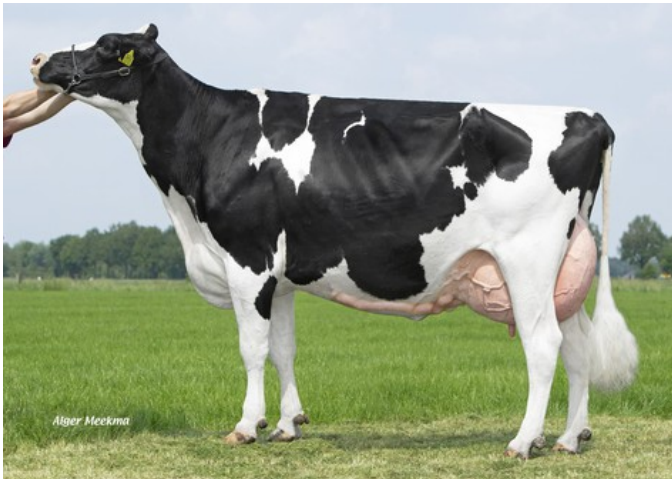
Holbra Malon 3 VG-88