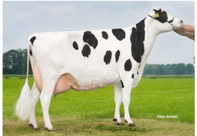
Holbra Malon VG-87

VG-88 Balisto x VG-87 Man-O-Man x VG-87 Mascol x VG-88 Durham x EX-90 Rudolph x EX-95 Chief Mark x EX-91 Sexation x EX-93 Elevation x EX-94 Highmark x EX-91 Bootmaker Lee