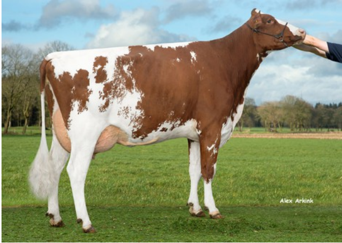
3STAR OH Sunnyside Red

McRanger RDC x Camden x Rubels-Red x GP-84 Salvatore Rc x Rubicon x GP-83 Cashcoin x VG-87 Snowman x EX-90 Planet x VG-85 Bolton x VG-87 Goldwyn