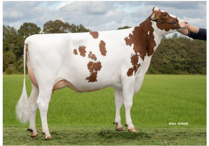
De Oosterhof 3STAR Juliane Red

Enclave x Star P RDC x GP-84 Rubels-Red x VG-85 Salvatore Rc x VG-89 Rubicon x VG-87 Supersire x VG-85 Alexander x EX-91 Goldwyn x EX-95 Durham x EX-93 Prelude