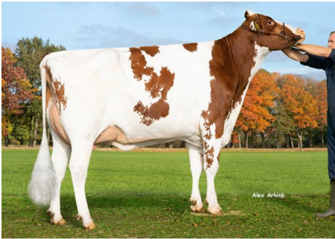
3STAR OH Alexia Red GP-84