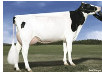
Des-Y-Gen Planet Silk EX-90