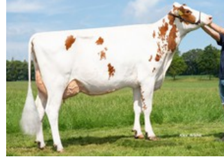
K&L SV Sunny Red GP-84