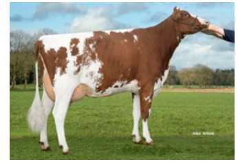
3STAR OH Sunnyside Red