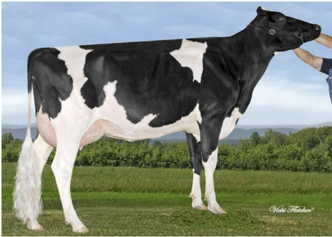
Gen-I-Beq Bolton Silence VG-85