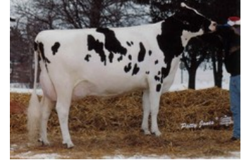
Glen Drummond Aero Flower VG-88

CR 7 P Red x Sorelio P x Rubels-Red x GP-84 Salvatore Rc x Rubicon x GP-83 Cashcoin x VG-87 Snowman x EX-90 Planet x VG-85 Bolton x VG-87 Goldwyn