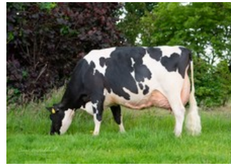
De Oosterhof DG Rose RDC VG-89