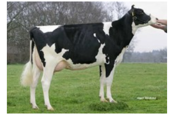
Holbra Manoa VG-85