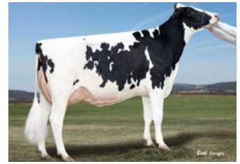
Gold-N-Oaks Arabell 1765 VG-88,