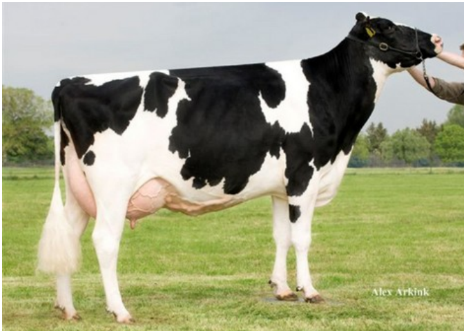
Holbra Pam VG-87