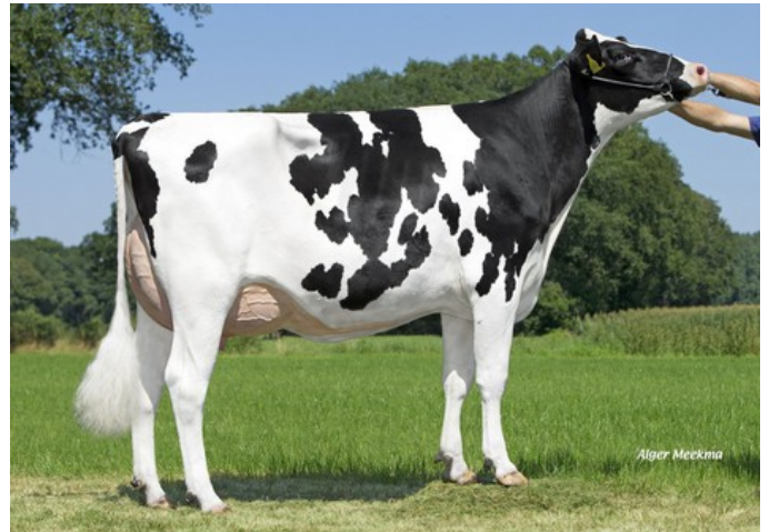
Schreur Serena 13 PP RDC VG-87

Borax-Red x Sailor PP x VG-87 Apo Red PP x VG-85 Silver x GP-83 Earnhardt P x GP-82 Colt P x VG-85 Socrates x VG-87 Goldwyn x VG-87 Durham x VG-86 Formation Hoornloze Borax-Red-dochter in de top 10 gNVI!