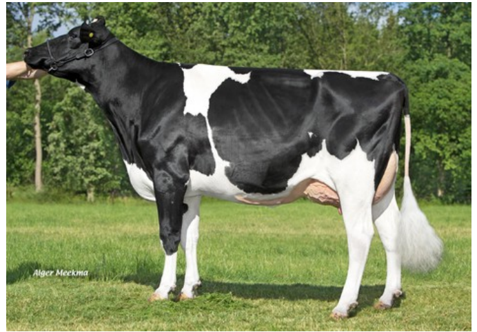
NRP Alisha RDC VG-89

Wendat x GP-83 Gladius x VG-86 Rubels-Red x VG-85 Salvatore Rc x VG-89 Rubicon x VG-87 Supersire x VG-85 Alexander x EX-91 Goldwyn x EX-95 Durham x EX-93 Prelude