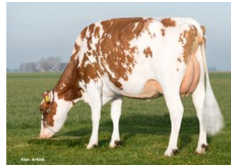
Batouwe Salsa Aiko Red VG-85