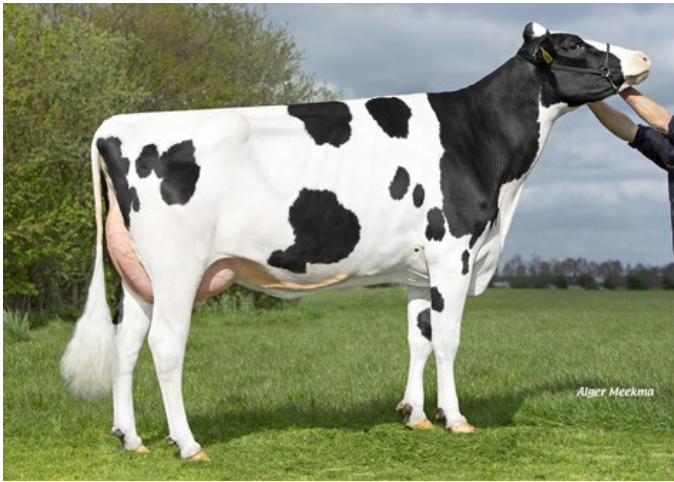
Koepon Altuve Range 7 RDC VG-87