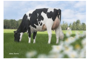
De Oosterhof DG Rose RDC VG-89