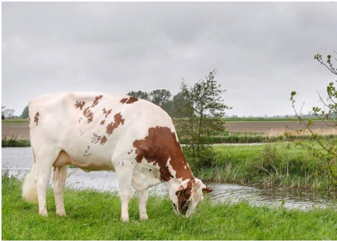
Lakeside Ups Red Range VG-86