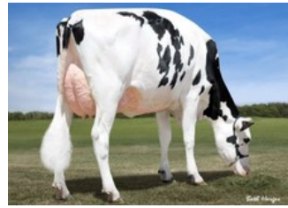
Dymentholm Sunview Sunday VG-87