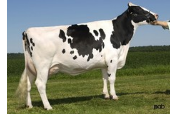
Glen Drummond Splendor VG-86

Tricky Red x Star P RDC x Rubels-Red x GP-84 Salvatore Rc x Rubicon x GP-83 Cashcoin x VG-87 Snowman x EX-90 Planet x VG-85 Bolton x VG-87 Goldwyn