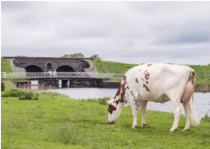
Lakeside Ups Red Range VG-86