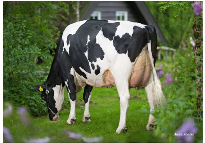
De Oosterhof Dg Rose RDC VG-89

Redlea RDC x VG-86 Gameday x GP-84 AltaAltuve RDC x VG-86 Salvatore Rc x VG-89 Rubicon x GP-83 Aikman RDC x VG-85 Man-O-Man x VG-87 Mascol x VG-88 Durham x EX-90 Rudolph