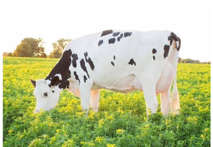
Dymenthalm Sunview Sunday VG-87

Pike RC x Ranger-Red x VG-86 Ronald RC x VG-88 Styx Red x Rubicon x GP-83 Cashcoin x VG-87 Snowman x EX-90 Planet x VG-85 Bolton x VG-87 Goldwyn