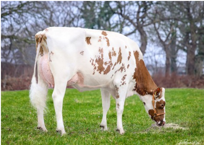
GIH Ronald Aura Red VG-86