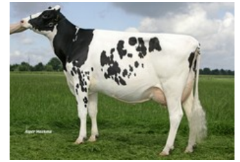
Koepon Shottle Classy 16 VG-85