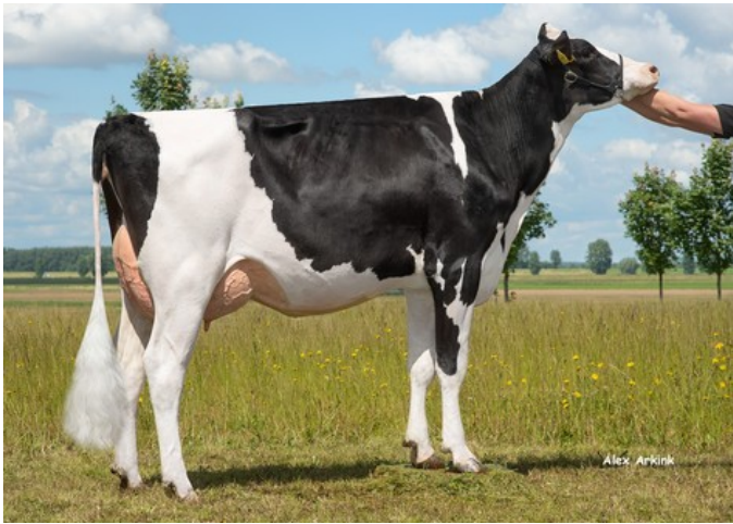
3STAR OH Shirly RDC GP-83